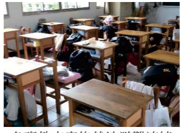
各班教室實施就地避難演練