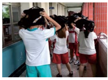
地震避難逃生演練疏散