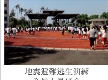
地震避難逃生演練 全校人員集合