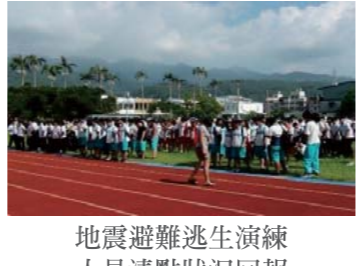
地震避難逃生演練 人員清點狀況回報