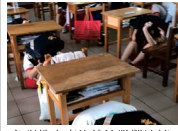
各班教室實施就地避難演練