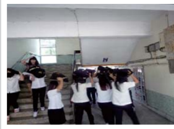
地震避難逃生演練疏散