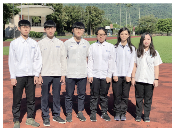
▲ 飲料調酒乙級通過同學