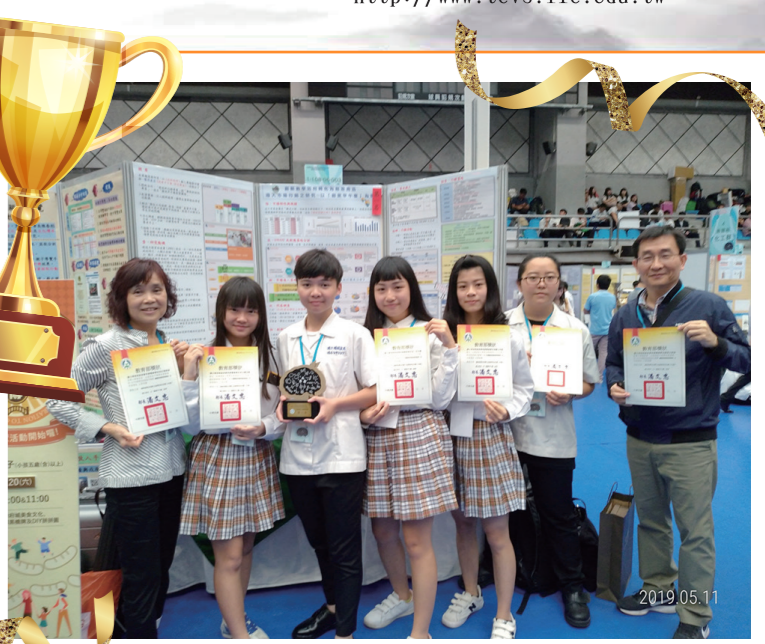
▲ 得獎同學與指導老師合影

頭城家商校長陳琨義表示,每年的專題暨創意製作競賽,各校參賽作品精銳盡出,體現高級中等學校專業群科教學成效及提升學生實務能力之重要性。頭城家商能在商業管理群的專題作品中脫穎而出、榮獲第一,在在顯示本校教師教學及研究認真、學生的創意與實務能力突出,具體展現技職教育再造的成果,且已搭建出高職學校與業界合作的管道。