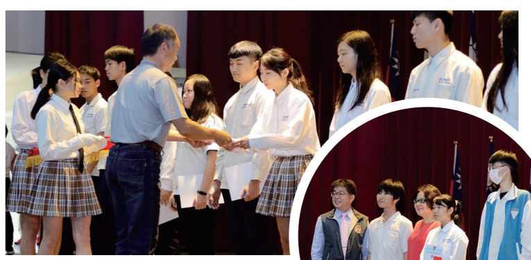
▲ 同學領取各項獎學金

關鍵字:新設科、觀光事務科、普通科、旅遊事務科、免試升學 頭家入學獎學金-獎項多、獎金豐-歡迎來領取