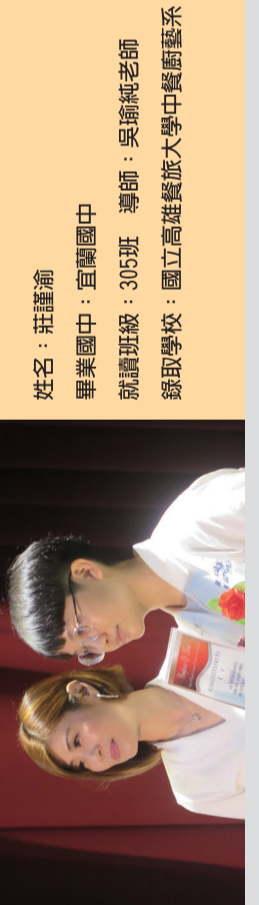
在校優良表現 ● 校內美術比賽西畫組第一名 ● 宜蘭真功夫創意料理技藝達人 銅牌 謹渝表示：很幸運能透過繁星計劃錄取餐飲科的夢幻學校，這真是人生中最快樂的事。感謝學校栽培，也祝福同學姊妹都能考上理想的學校。