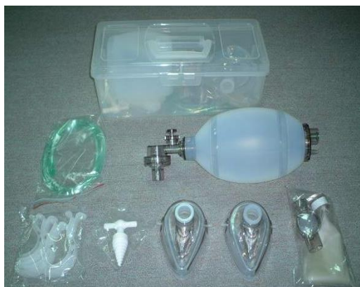
圖一 攜帶式人工甦醒器