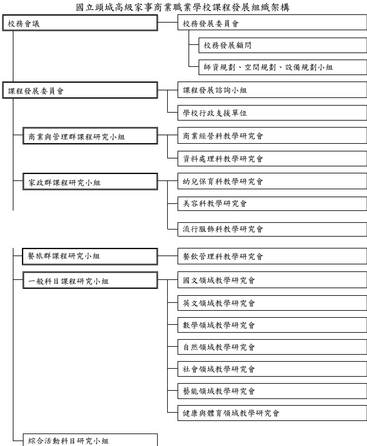
圖 2.2.1.1. 課程發展組織架構圖