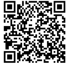
報名用 QR Code

三、為因應新型冠狀病毒肺炎(COVID-19)疫情，每場次報名人數上限 20 人 （額滿截止報名），若報名後臨時無法參加請通知我們，我們將此名額給予下一位候補參與者。