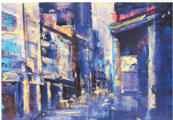
(2021) 第二名 復興商工 呂斌諺