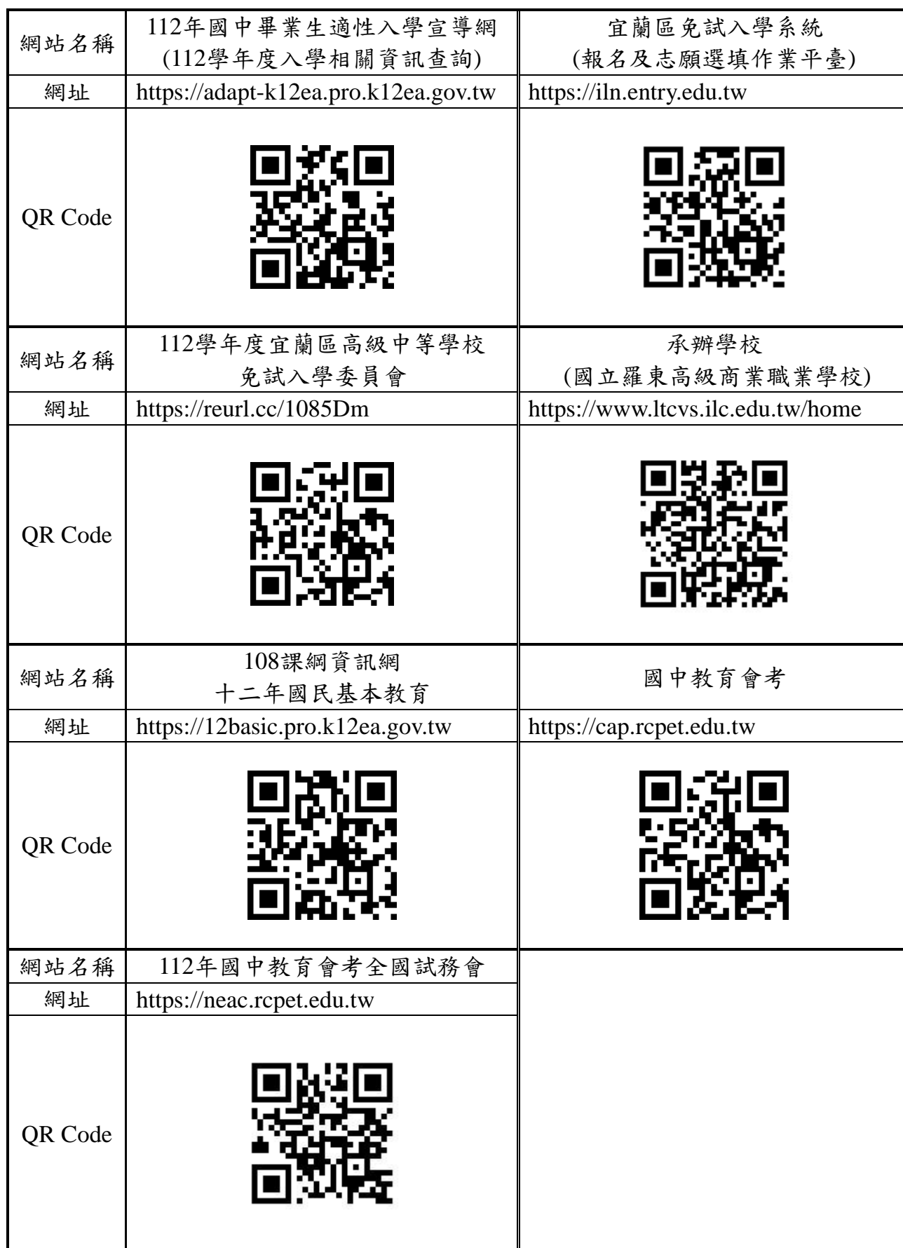
112學年度宜蘭區高級中等學校免試入學參考網站一覽表