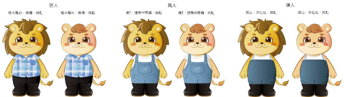
圖 1. 梅克獅圖樣